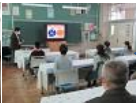
非行防止教室:KDDIスマホ・ケータイ安全教室指導員を講師にお招きして全学年で、情報モラルについて学習しました。