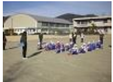
避難訓練:休み時間を想定した避難訓練を実施しました。