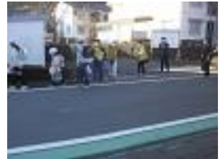
朝の登校指導の様子:保護者、地域の方にもお世話になっています。