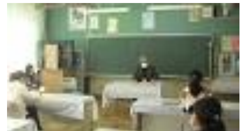
入学説明会:令和4年度は6名の新1年生が入学します。