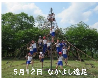
5月12日 なかよし遠足

「みにくいアヒルの子」を題材に校長が人権感覚についての話をしました。児童は集中して話を聞きました。